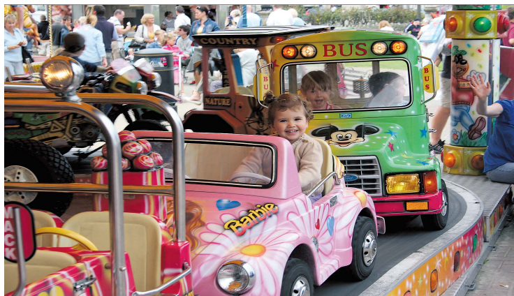
Auch für die Kleinen bietet die WISA Unterhaltung - auf dem eigenen Vergnügungspark schlagen bei einer Karussellfahrt Kinderherzen höher.