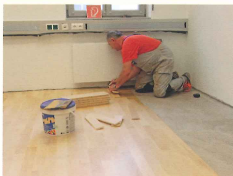
Verkleben des 2 Schichtparkett „Kanadische Ahorn“.