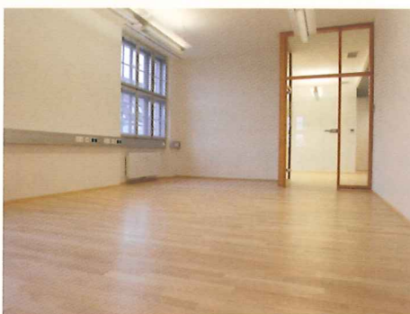
Einer der Büroräume mit fertig verlegten Parkett.

Eco Prim PU 1K Turbo ist ein sehr emissionsarmer, einkomponentiger Reaktionsharzvoranstrich zum Grundieren, Verfestigen und Absperrern.