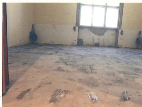
Der alte Estrich musste unbedingt überarbeitet werden.