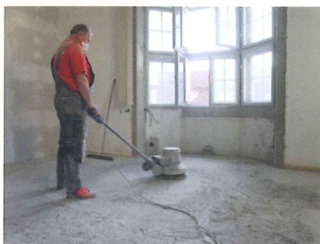
Abfäsen des alten Estriches im 4. Obgeschoß.